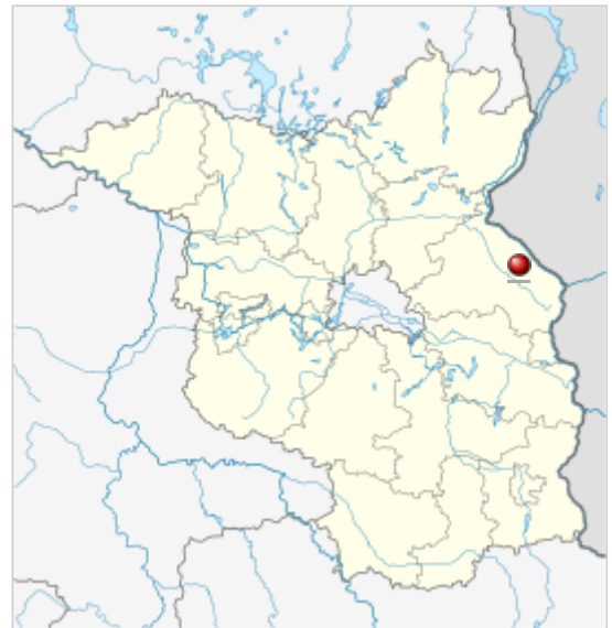
Lage von Wilhelmsaue in Brandenburg