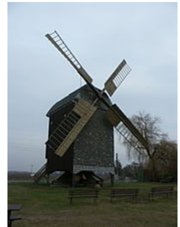
Bockwindmühle in Wilhelmsaue, 2005