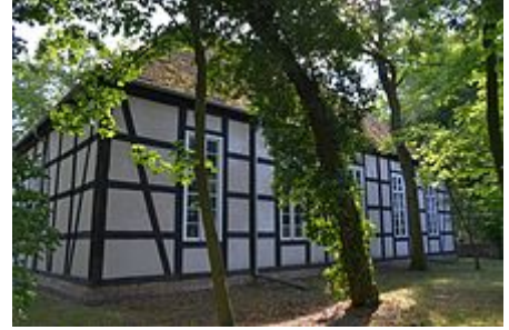
Dorfkirche in Wilhelmsaue